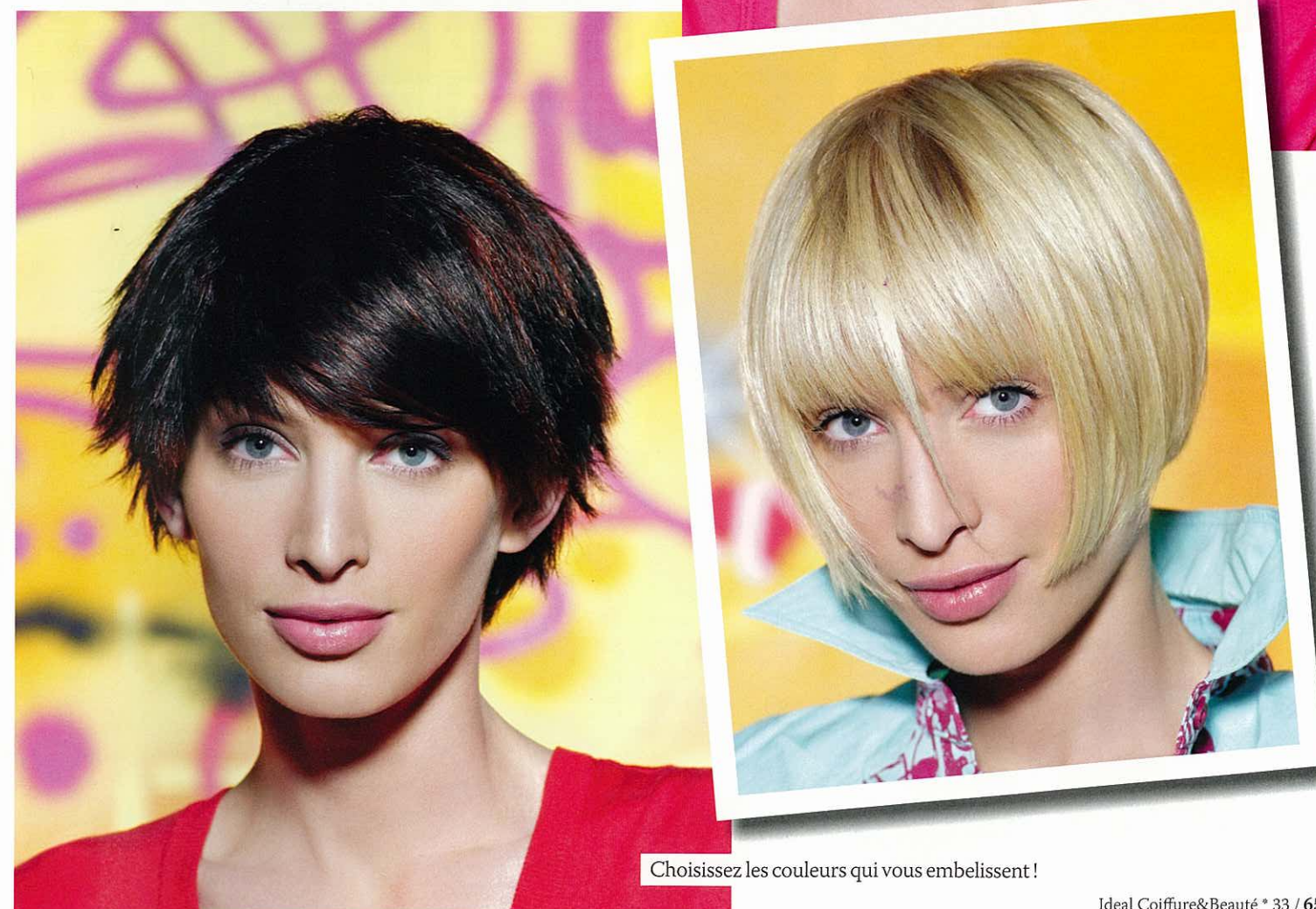
Choisissez les couleurs qui vous embellissent !