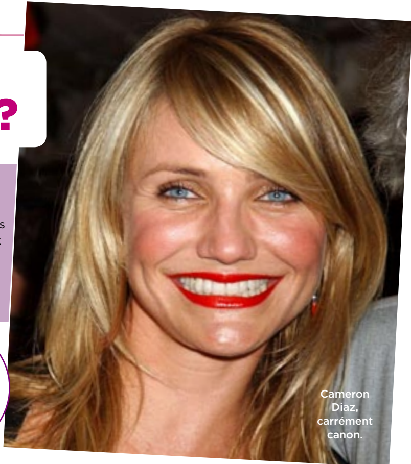
Cameron Diaz, carrément canon.

Les visages carrés sont assez larges et anguleux, et les maxillaires sont très développés. Très souvent, la ligne d'implantation des cheveux est horizontale, ce qui va fortement accentuer leur côté un peu « mastoc ». On dit que les femmes qui ont cette forme de visage ont une grande force de caractère.