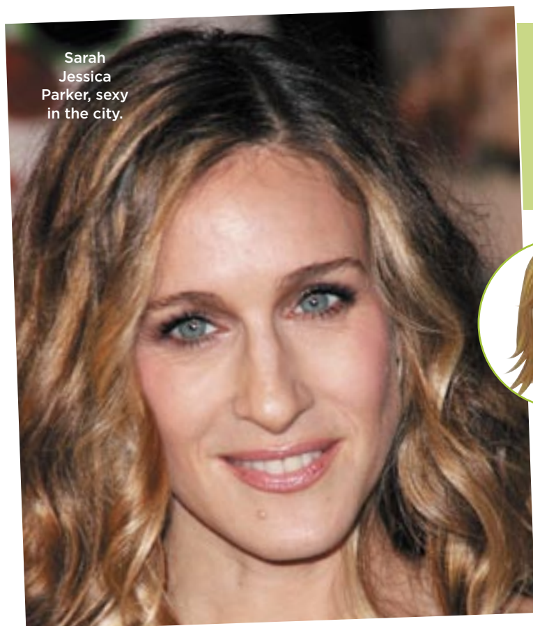
Sarah Jessica Parker, sexy in the city.

« Avec ce type de visage, on peut se permettre beaucoup de longueurs allant même jusqu'au très court. Avec cette forme passe-partout, vous allez aussi pouvoir oser une frange en prenant soin de l'harmoniser avec la forme de votre nez. »